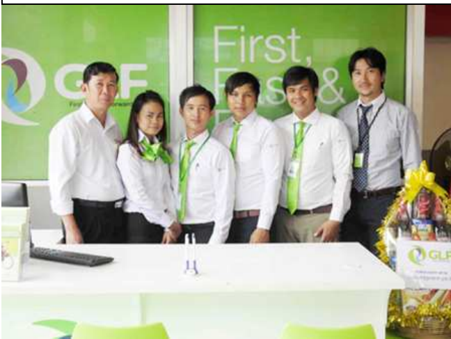
HONDA KHOY VETH オーナーと GLF 社員