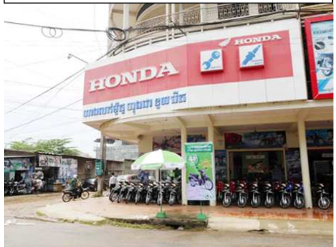
HONDA KHOY VETH ディーラー店舗