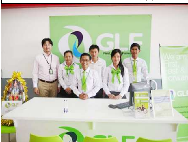
HONDA PIN TY1 オーナーと GLF 社員