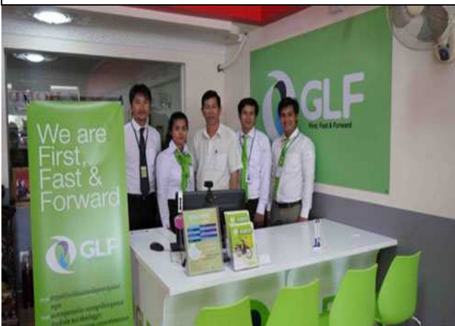
HONDA SENG HOUT のオーナーと GLF 社員