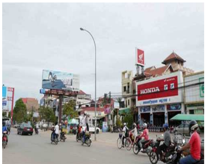
HONDA SIEM REAP1 デイラー店舗