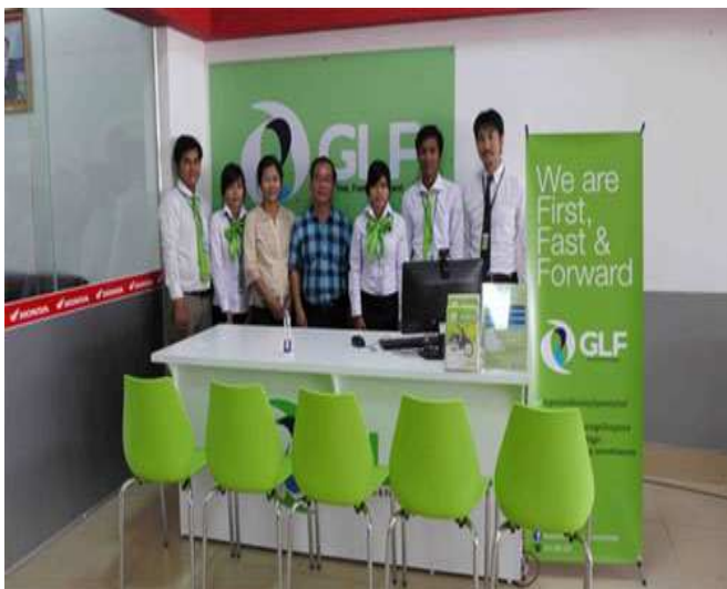
HONDA SIEM REAP1 のオーナーと GLF 社員