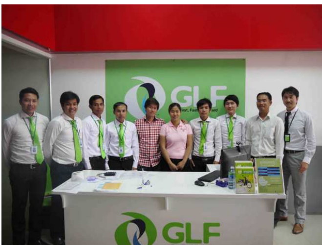
HONDA CHINGLONG のオーナーと GLF 社員