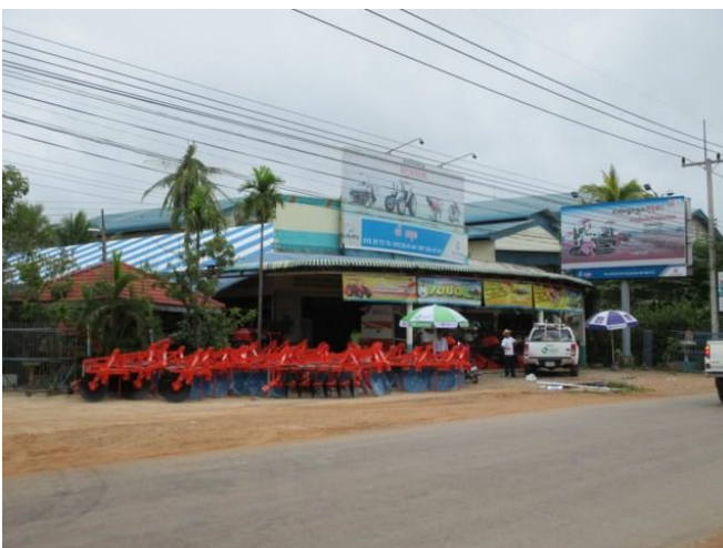
KUBOTA YEE CHHUN ディーラー店舗