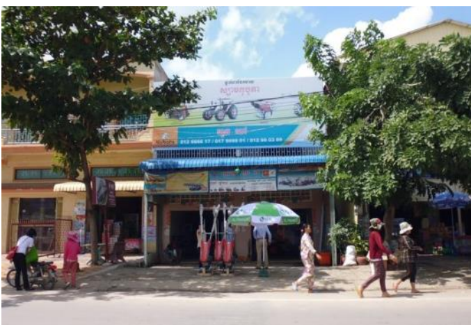
KUBOTA HUOT PEOV ディーラー店舗