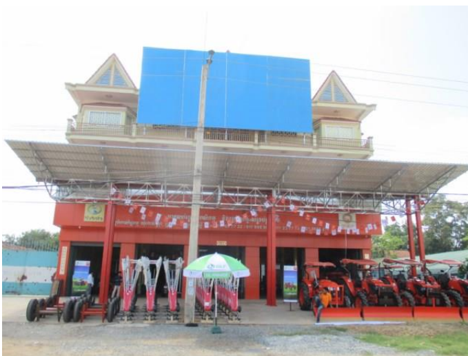
KUBOTA SENG HUY ディーラー店舗