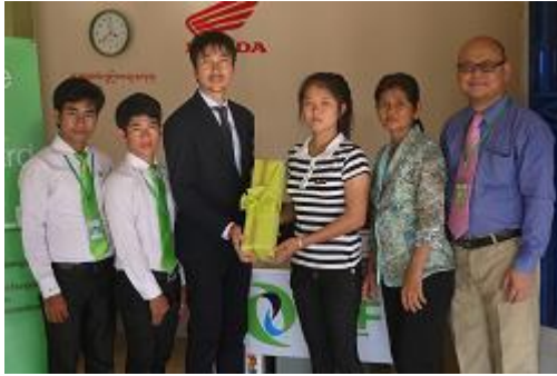
HONDA Huy Houk Thma Koul