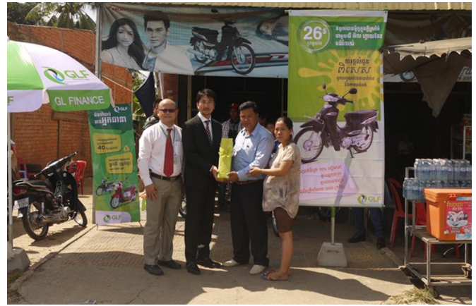
新営業拠点開設後の営業地域