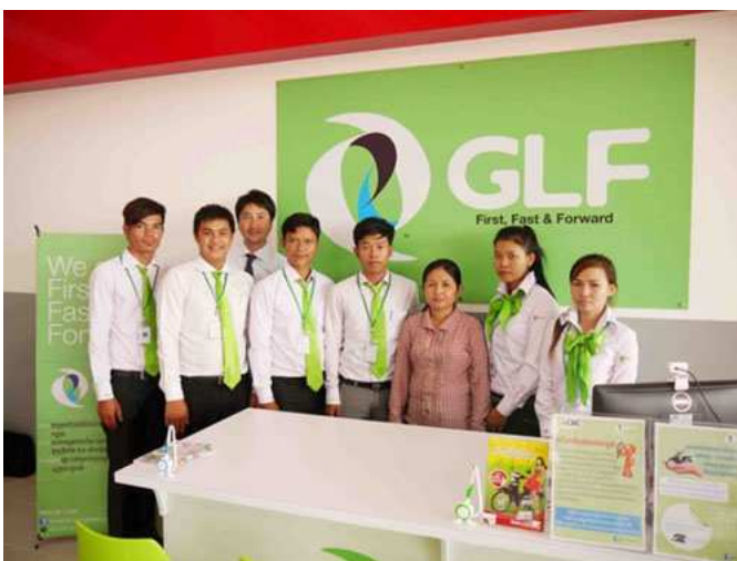
HONDA KHY BOPHA のオーナーと GLF 社員