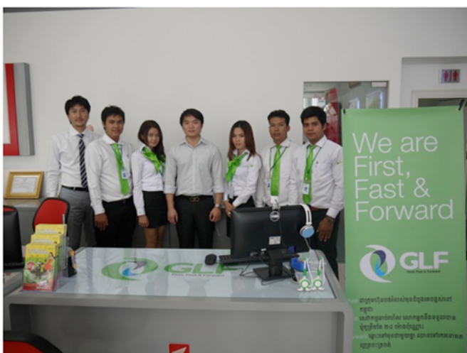
HONDA MEAN LEAP のオーナーと GLF 社員