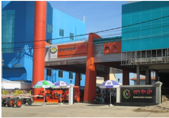
KUBOTA HUOT SROENG